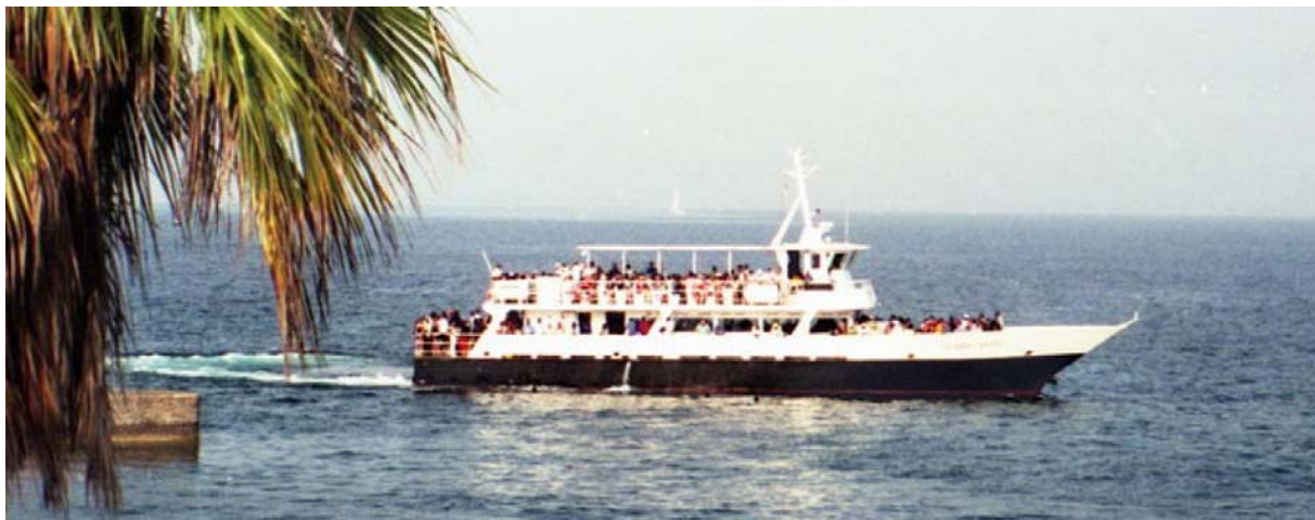
Tableau des horaires